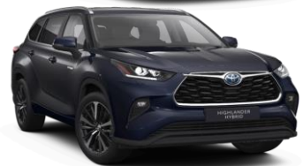
Темно сина металик (8X8)