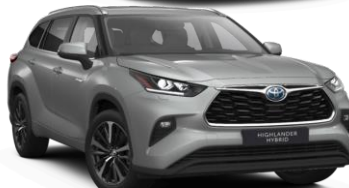
Сребрена металик (1J9)