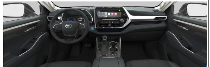
Црна перфорирана кожа со сив штеп во ромбидни форми (LA20) кај Luxury Premium