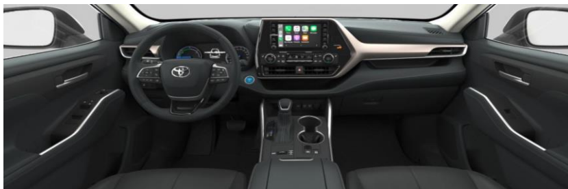
Црна еко кожа со црн штеп (EB20) кај Executive