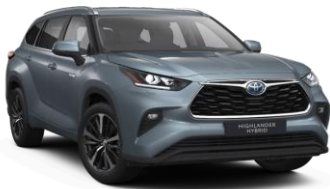
Лунарно сива (1K5)