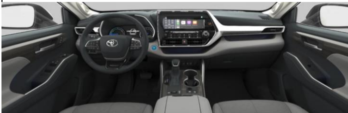
Сива перфорирана кожа со сив штеп во ромбидни форми (LA10) кај Luxury Premium