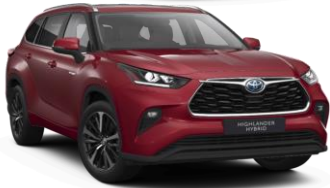
Токио црвена (3T3)