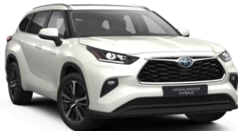
Бела бисерна (070)