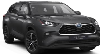
Графитно сива металик (1G3)