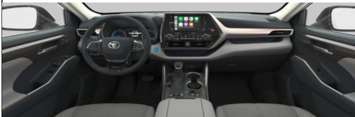
Сива перфорирана кожа со сив штеп (LB10) кај Luxury