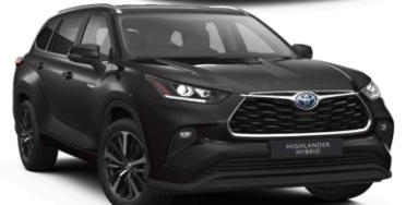
Темно кафена металик (4X9)

Цена за бои со бисерен ефект: Бисерно бела 070, Лунарно сива 1K5, Токио црвена 3T3 - 500 €.