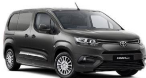
Темно сива (EVL) металик