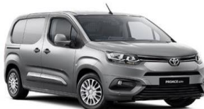
Сребрена (KCA) металик