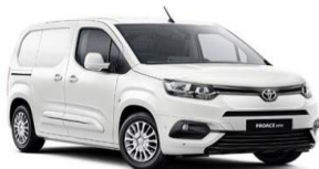
Бела (EWP) неметалик