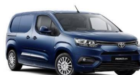
Сина (EJG) металик