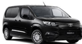
Црна (EXY) неметалик