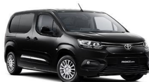
Црна (EXY) неметалик