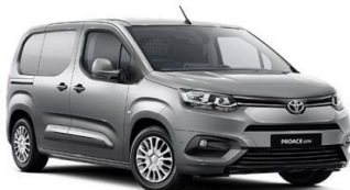
Сребрена (KCA) металик