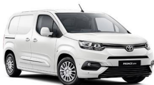
Бела (EWP) неметалик