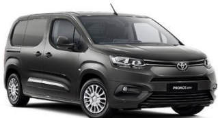
Темно сива (EVL) металик