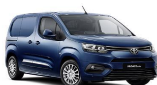
Сина (EJG) металик