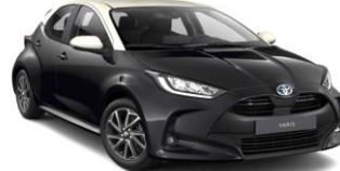
Night Sky Black со бел кров (2ND)*