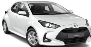
Platinum Pearl White (089)**