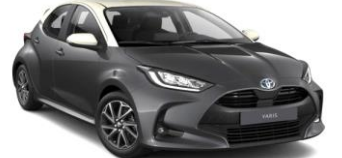
Ash Grey со бел кров (2SV)*