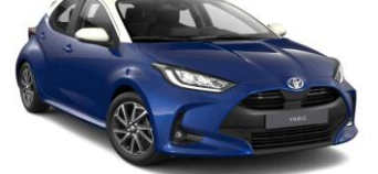
Cobalt Blue со бел кров (2ST)*

*двобојните комбинации на бои се достапни само кај ниво на опрема ViTON вклучени во цена