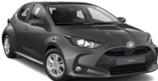
Ash Grey (1G3)