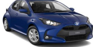
Cobalt Blue (8W7)