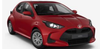
Emotional Red (3U5)**