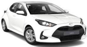
Pure White (040)