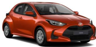
Orange Spice (4R8)