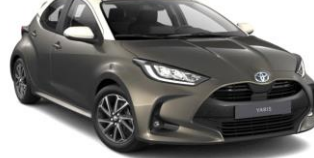
Oxyde Bronze со бел кров (2SU)*