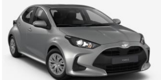
Metal Grey (1L0)