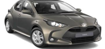
Oxyde Bronze (6X1)