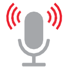
ГЛАСОВЕН АГЕНТ (СЕ АКТИВИРА ПРЕКУ КОПЧЕ НА УПРАВУВАЧОТ)