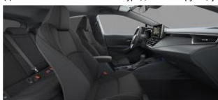
Црна внатрешност (код FB20)