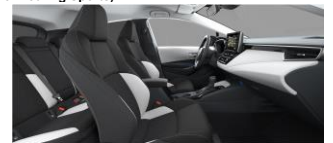
Црно/светло сива внатрешност со светол таван (код FB10)