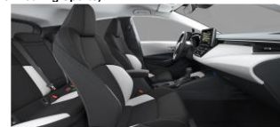
Црно/светло сива внатрешност со светол таван (код FB10)