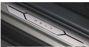
Алуминиумски лајсни на праговите