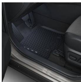
Гумени патосници за кабината