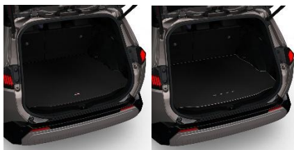
Текстилна подлога за багажника