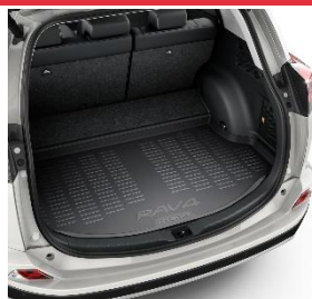
Гумена подлога за багажникот