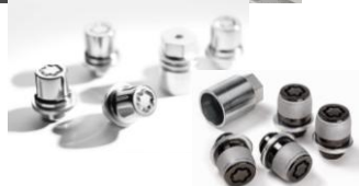
Безбедносни навртки за алуминиумски наплатки