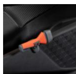
Чекан за итни случаи