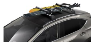
Голем држач за скии или сноуборд