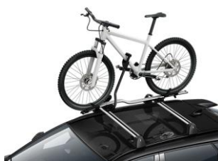
Држач за велосипед