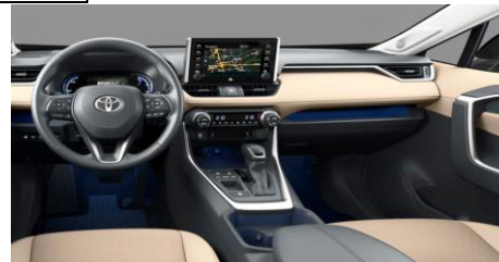
Ниво на опрема Lounge/Lounge Premium

• За подетални технички информации ве молиме симнете го прирачникот за користење на возилото на следниот линк: http://www.toyota.com.mk/model/rav4-2019/