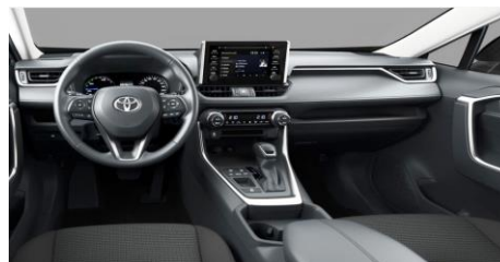
Ниво на опрема Active