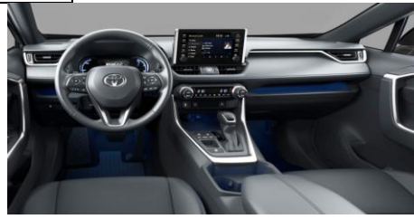
Ниво на опрема Exclusive