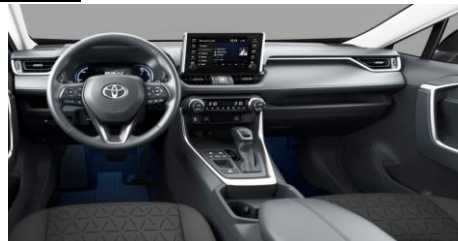
Ниво на опрема Dynamic