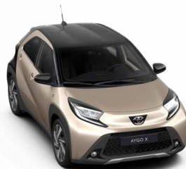
2VJ Беж со црн покрив металик, двобојна 500 € /31,000 Ден