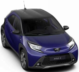
2V1 Мастило сина со црн покрив металик, двобојна 500 € /31,000,00 Ден