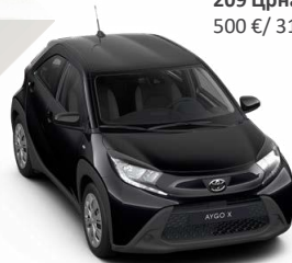
209 Црна металик 500 € / 31.000,00 Ден