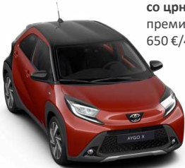
2VH Чили црвена со црн покрив премиум, двобојна 650 € /40,300,00 Ден