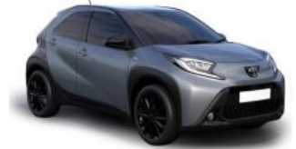
1K3 Сиво Сина металик 500 € / 31.000,00 Ден- НОВО