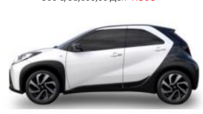
2NR Бела со црн покрив металик, двобојна 500 €/31,000,00 Ден- НОВО