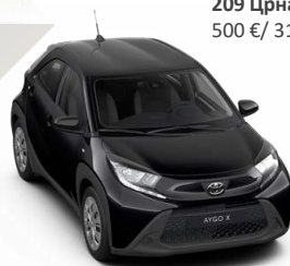
209 Црна металик 500 € / 31.000,00 Ден