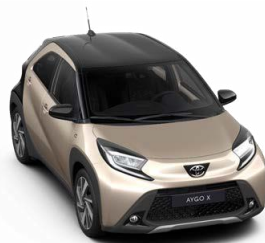
2VJ Беж со црн покрив металик, двобојна 500 € /31,000 Ден