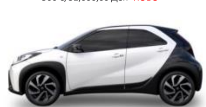
2NR Бела со црн покрив металик, двобојна 500 € /31,000,00 Ден- НОВО