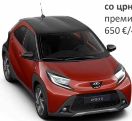
2VN Чили црвена со црн покрив премиум, двобојна 650 € /40,300,00 Ден