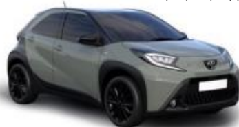
2VH Сиво зелена со црн покрив премиум, двобојна 650 € /40,300,00 Ден- НОВО