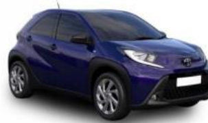
8Y8 Сина металик 500 € / 31.000,00 Ден