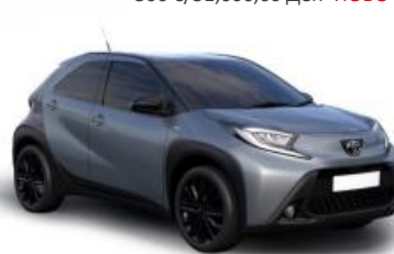
2UP Сиво сина со црн покрив металик, двобојна 500 € /31,000,00 Ден- НОВО