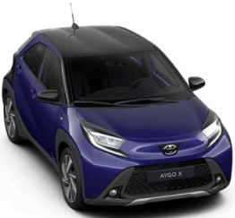
2V1 Мастило сина со црн покрив металик, двобојна 500 € /31,000,00 Ден